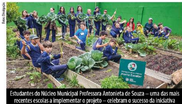
Estudantes do Núcleo Municipal Professora Antonieta de Souza – uma das mais recentes escolas a implementar o projeto – celebram o sucesso da iniciativa