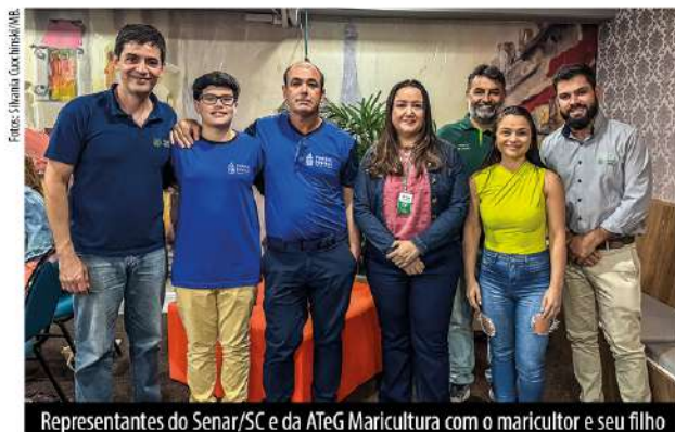
Representantes do Senar/SC e da ATeG Maricultura com o maricultor e seu filho