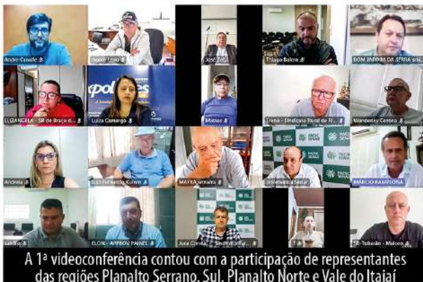
A 1ª videoconferência contou com a participação de representantes das regiões Planalto Serrano, Sul, Planalto Norte e Vale do Itajaí

O vice-presidente de finanças da Faesc comentou, ainda, sobre o bom momento na pecuária e falou sobre os resultados das feiras. “As feiras representam uma grande oportunidade para o produtor mostrar a qualidade de sua produção e agregar valor na comercialização”.