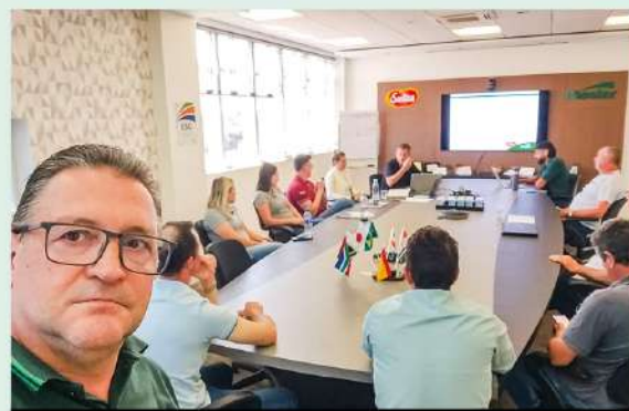
Reunião Cadec Suínos Terminação Master, com indústria no dia 25/11

Criadas pela Lei da Integração (Lei 13.288/2016) para promover a transparência na relação contratual entre produtores integrados e agroindústrias, as CADECs (Comissões para Acompanhamento, Desenvolvimento e Conciliação da Integração) vem fortalecendo sua atuação. As CADECs catarinenses são orientadas e assessoradas pelo Sistema Faesc/Senar, em parceria com os Sindicatos Rurais e entidades do agronegócio. Desde 2020, a Faesc e os Sindicatos Rurais oferecem assessoria técnica e jurídica gratuita para suinocultores, avicultores e fumicultores. Confira alguns registros das últimas reuniões de 2024!