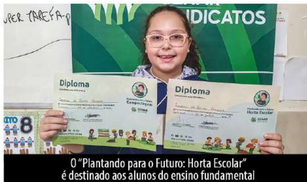
O “Plantando para o Futuro: Horta Escolar” é destinado aos alunos do ensino fundamental