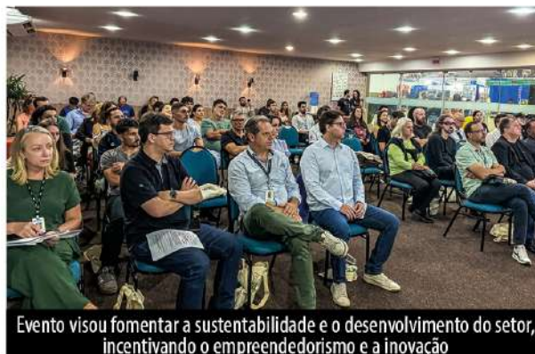
Evento visou fomentar a sustentabilidade e o desenvolvimento do setor, incentivando o empreendedorismo e a inovação