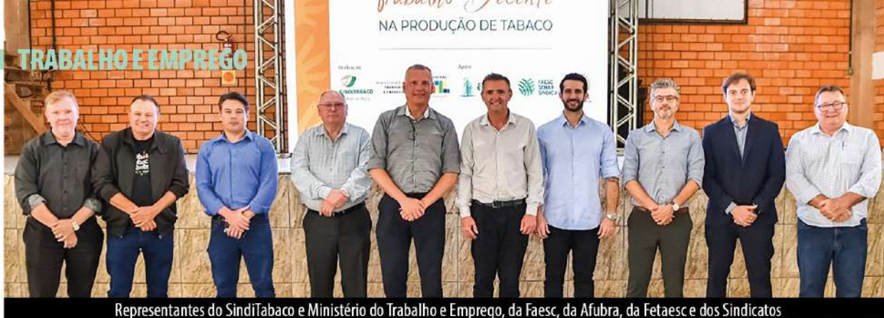
Representantes do SindiTabaco e Ministério do Trabalho e Emprego, da Faesc, da Afubra, da Fetaesc e dos Sindicatos