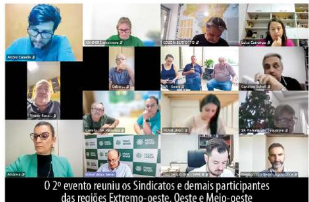
O 2º evento reuniu os Sindicatos e demais participantes das regiões Extremo-oeste, Oeste e Meio-oeste