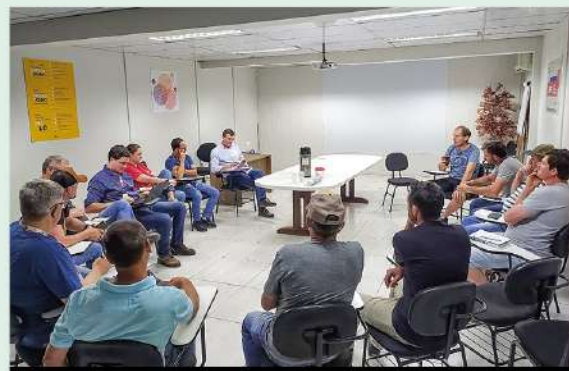
Reunião de Cadec frango de corte BRF Concórdia, 26/11