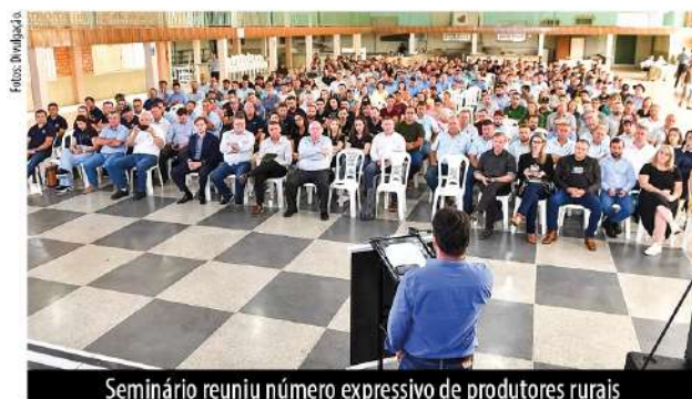
Seminário reuniu número expressivo de produtores rurais

De acordo com a Afubra, Canoinhas é o segundo maior município produtor de tabaco em Santa Catarina. No país, ocupa a 7ª posição entre as maiores unidades da federação produtoras dessa cultura.