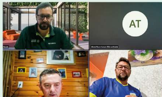
Reunião Cadec frango de corte Grupo BTZ Ipuacu, no dia 04/12