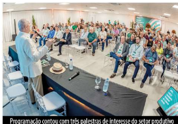
Programação contou com três palestras de interesse do setor produtivo