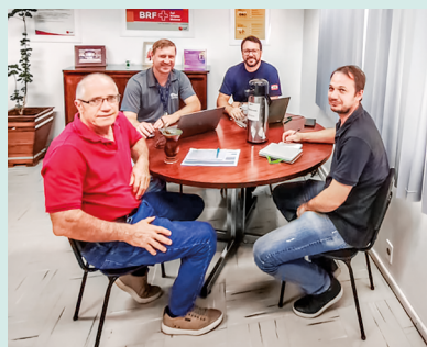
Reunião levantamento de custo da Cadec produção de ovos - MBrf Concórdia (09/04)

As Comissões para Acompanhamento, Desenvolvimento e Conciliação da Integração (Cadecs), instituídas pela Lei da Integração (13.288/2016), mantêm uma agenda intensa de reuniões com foco no fortalecimento do diálogo e da transparência nas cadeias produtivas integradas. Em SC, as Cadecs atuam nos segmentos de avicultura, fomicultura e suinocultura. Produtores interessados em acessar a estrutura e as capacitações do Sistema Faesc/Senar/Sindicatos podem entrar em contato com o Sindicato Rural de seu município. Confira registros de alguns dos mais recentes encontros!