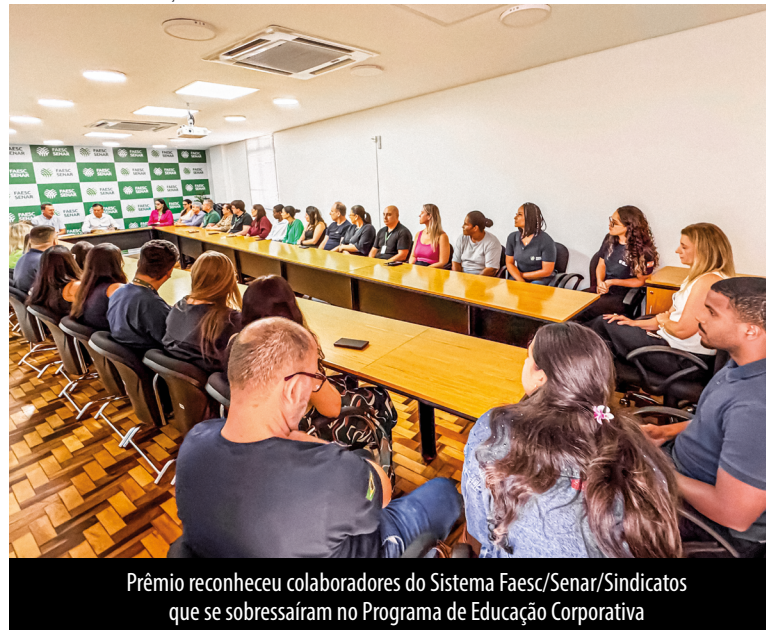
Prêmio reconheceu colaboradores do Sistema Faesc/Senar/Sindicatos que se sobressaíram no Programa de Educação Corporativa