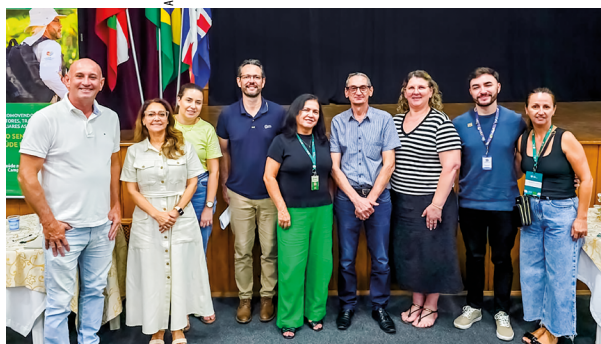
Representantes de municípios do Sul participaram da reunião sobre o Programa