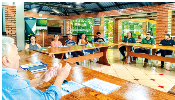
Encontro apresentou o Programa aos municípios da área de abrangência do Sindicato de Xanxerê

No Oeste, o Programa Saúde no Campo foi apresentado a representantes de oito municípios: Xanxerê, Xaxim, Lajeado Grande, Marema, Bom Jesus, Ipuçu, Entre Rios e Faxinal dos Guedes. Ao todo, 90 propriedades serão atendidas na região, com execução em parceria com os Sindicatos de Xanxerê e Faxinal dos Guedes.