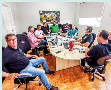
Reunião Cadec frango corte - Seara Itapiranga (14/04)