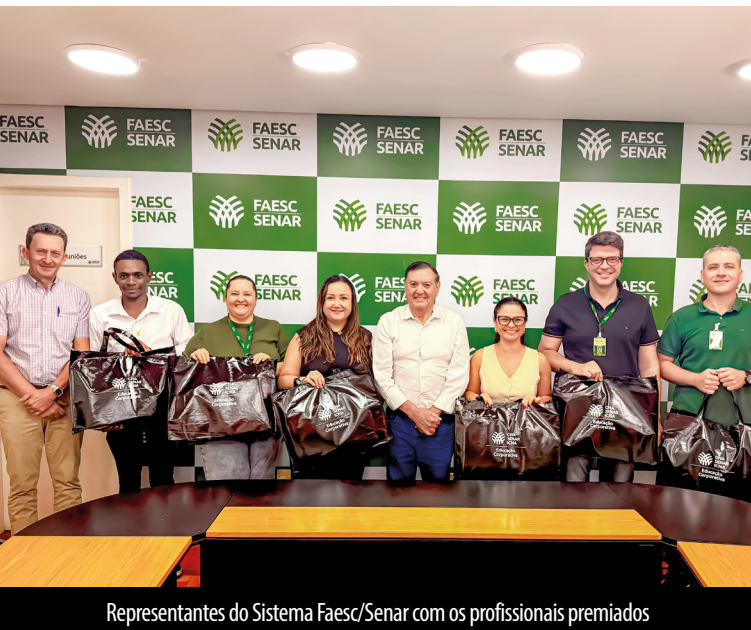
Representantes do Sistema Faesc/Senar com os profissionais premiados