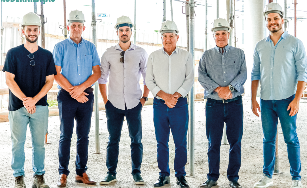
Diretores do Sistema Faesc/Senar e equipe técnica da obra, durante visita ao novo espaço