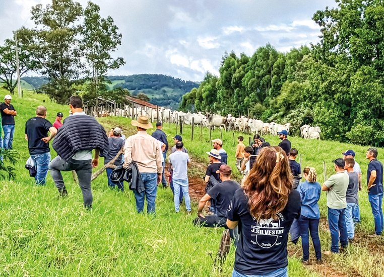
Visita reuniu 45 participantes