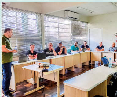
Reunião Cadec suínos terminação - JBS Seara (01/04)