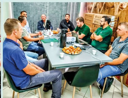
Reunião Cadec frango de corte - Jaguá Frangos, Ipuçu (08/04)