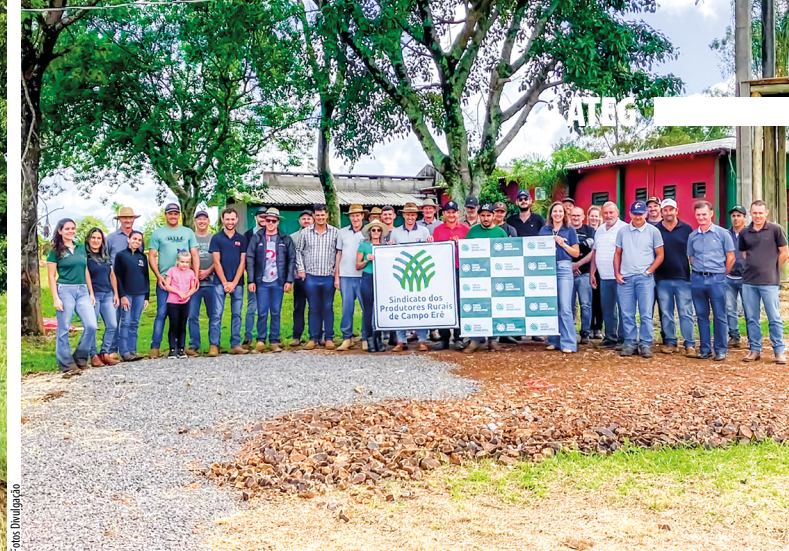
Produtores rurais, equipe técnica e representantes do Sistema Faesc/Senar/Sindicatos