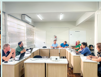
Reunião Cadec frango - Griller Seara (20/04)