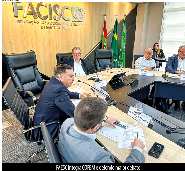
FAESC integra COFEM e defende maior debate