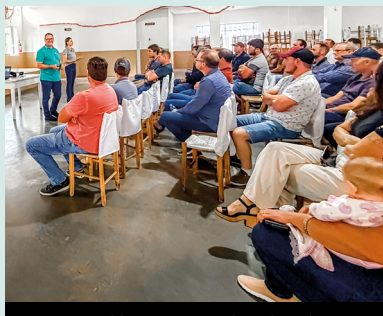
Assembleia novos membros da Cadec Suínos Terminação - MASTER Videira (14/04)