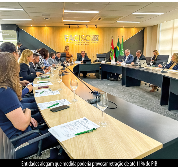
Entidades alegam que medida poderia provocar retração de até 11% do PIB