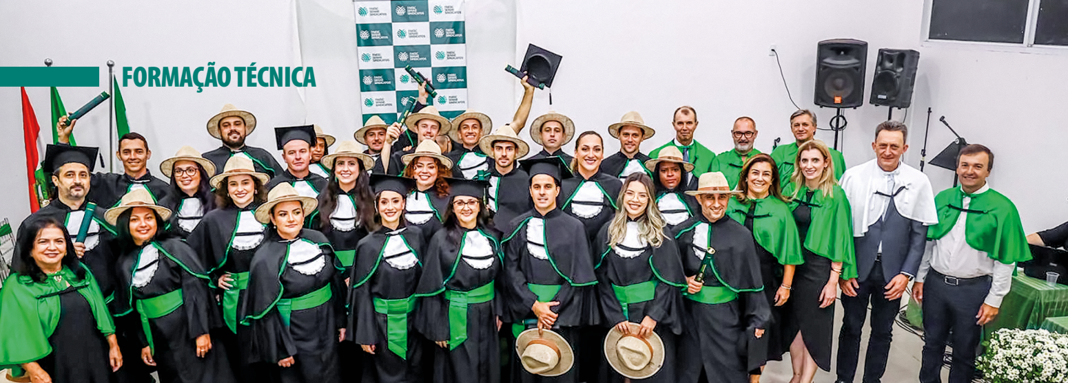
Recém-formados e lideranças celebram a conquista