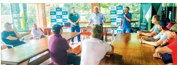
Reunião CadeC frango de corte grupo BTZ Ipuacu em março