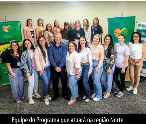
Equipe do Programa que atuará na região Norte