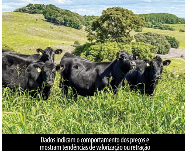
Dados indicam o comportamento dos preços e mostram tendências de valorização ou retração

Começou a divulgação dos resultados dos Leilões de terneiros de 2026. A Federação da Agricultura e Pecuária do Estado de Santa Catarina (Faesc) reforça aos pecuaristas catarinenses para que confirmem os primeiros resultados parciais deste ano. Os dados, atualizados em março, foram divulgados pelo Grupo de Melhoramento Genético (GMG) da Universidade do Estado de Santa Catarina (Udesc).