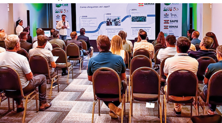
Evento reuniu o comitê gestor do CAR e entidades representantes do setor produtivo