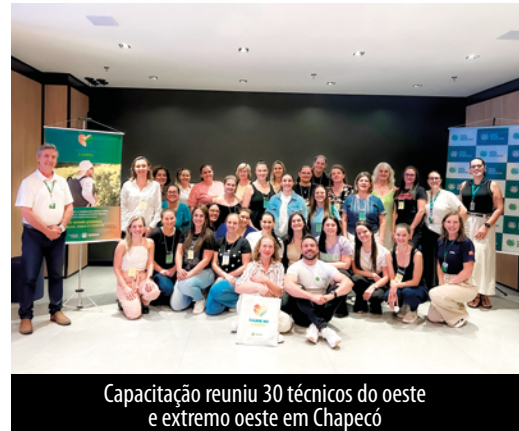
Capacitação reuniu 30 técnicos do oeste e extremo oeste em Chapecó