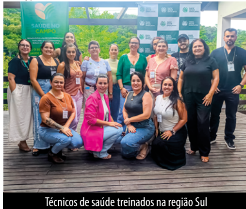
Técnicos de saúde treinados na região Sul