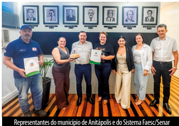
Representantes do município de Anitápolis e do Sistema Faesc/Senar

O encontro alinhou o apoio do Sistema Faesc/Senar para a realização de iniciativas no município, entre elas a organização da 2ª Feira do Chuchu, evento que valoriza a produção agrícola local e promove a integração da comunidade. Também foi discutida a parceria para a realização do Encontro Municipal de Saúde da Família, iniciativa voltada à promoção da prevenção e do bem-estar