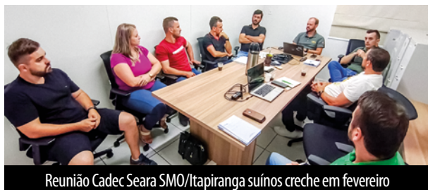
Reunião CadeC Seara SMO/Itapiranga suínos creche em fevereiro