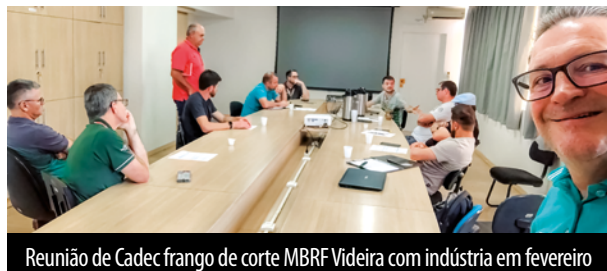
Reunião de CadeC frango de corte MBRF Videira com indústria em fevereiro