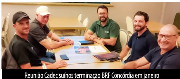
Reunião CadeC suínos terminação BRF Concórdia em janeiro

O Sistema Faesc/Senar, em parceria com os Sindicatos Rurais e entidades representativas do setor, oferece orientação técnica e assessoramento contínuo. Esse trabalho garante que os integrantes das CadeCs tenham acesso a informações qualificadas, capacitação e suporte jurídico essenciais para uma atuação segura e eficiente. Nos primeiros meses deste ano, uma série de reuniões foi realizada com o objetivo de alinhar estratégias, esclarecer dúvidas e fortalecer a atuação das comissões. Confira alguns registros!