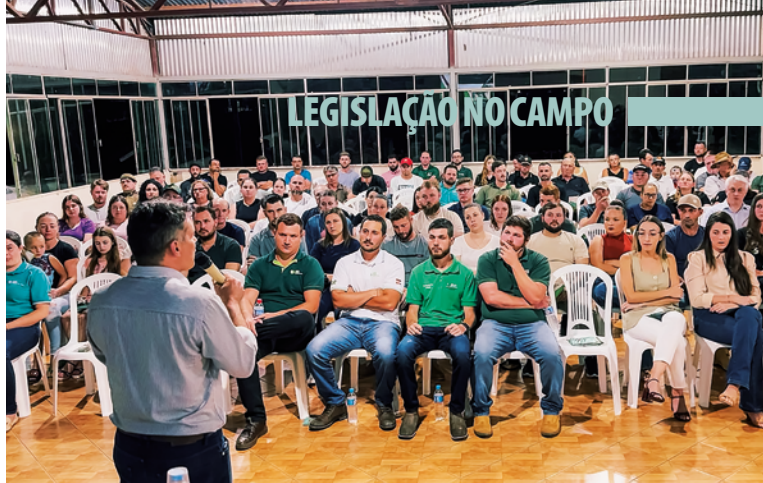
Evento reuniu produtores rurais e parceiros do setor produtivo