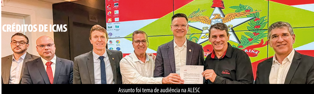
Assunto foi tema de audiência na ALESC